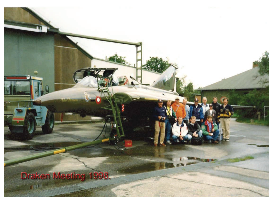
Draken Meeting 1998.